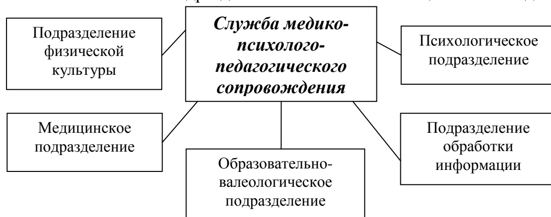
Рисунок. Организационная структура службы медико-психолого-педагогического сопровождения образовательной деятельности в МОУ Октябрьском сельском лицее

Соответственно подразделение физического воспитания объединяет преподавателей физической культуры, а также тренеров-педагогов дополнительного образования, ведущих в учебных заведениях спортивные секции. Психологическое подразделение – психолога и социального педагога.